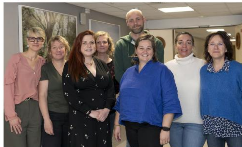
Les IPA du CHU